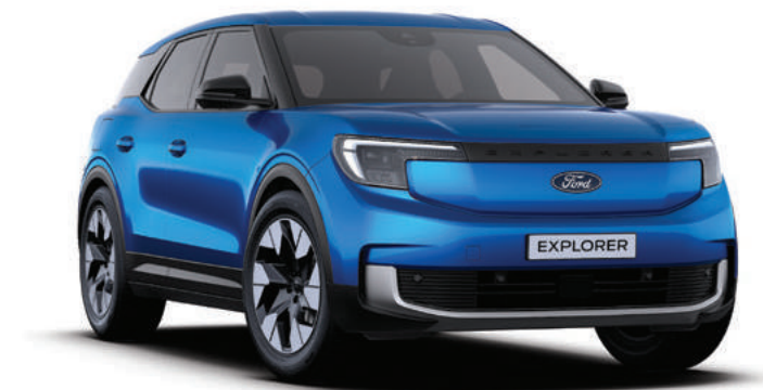
BLUE MY MIND - LAKIER METALIZOWANY SPECJALNY 4 500,-