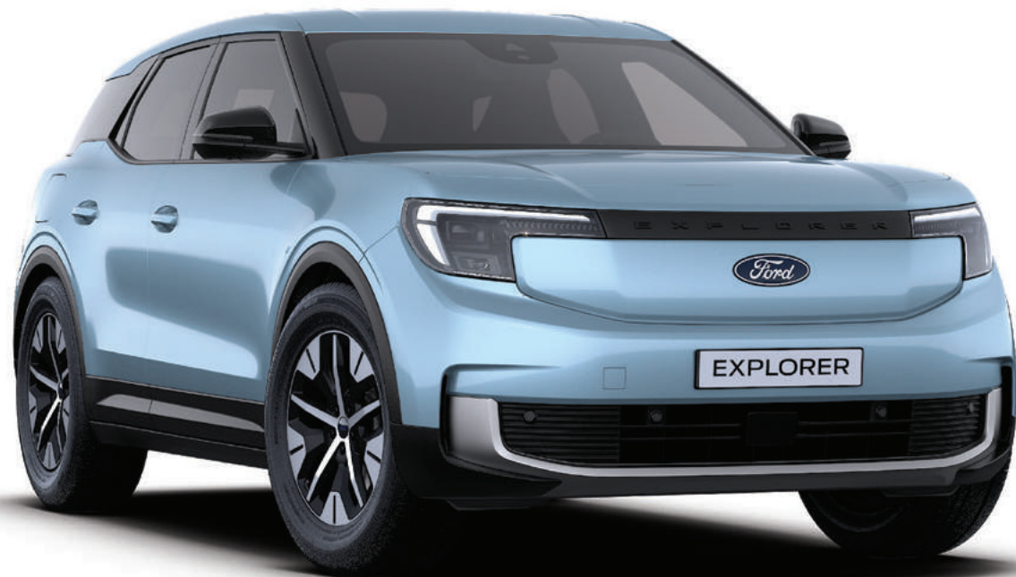
NOWY FORD EXPLORER KOLOR NADWOZIA: ARCTIC BLUE (BEZ DOPŁATY)