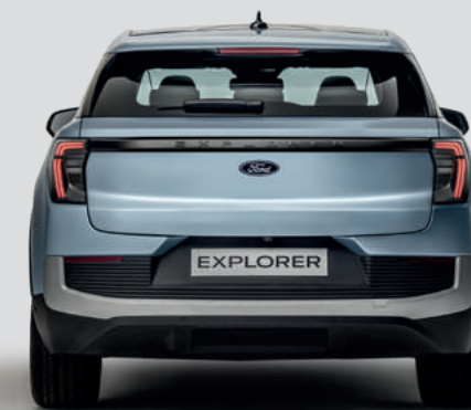
SZEROKOŚĆ CAŁKOWITA Z LUSTERKAMI: 2063 mm