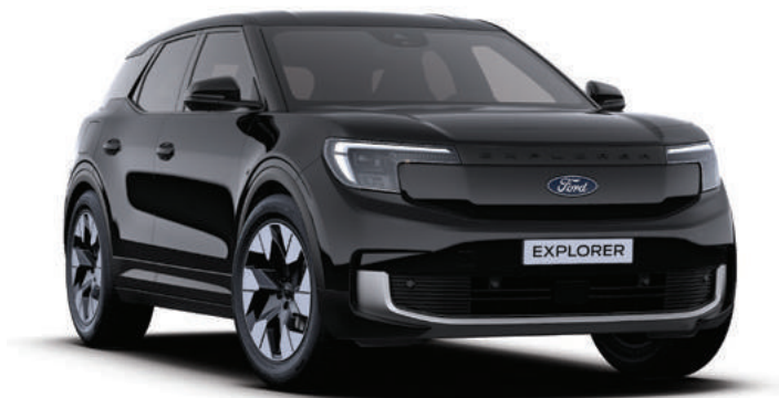
AGATE BLACK - LAKIER METALIZOWANY 3 000,-