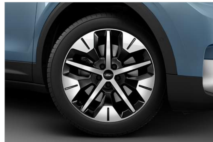
19" OBRĘCZE KÓŁ ZE STOPÓW LEKKICH, OGUMIENIE: PRZÓD 235/55, TYŁ: 255/50 Standard dla wersji EXPLORER