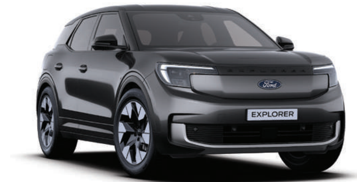
MAGNETIC GREY - LAKIER SPECJALNY 3 000,-