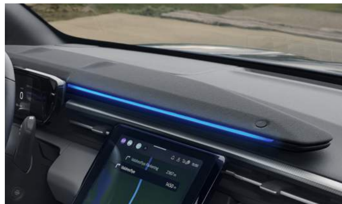
SYSTEM NAGŁOSNIENIA PREMIUM B&O - 10 GŁOŚNIKÓW (W TYM SUBWOOFER) Standard dla wersji Premium