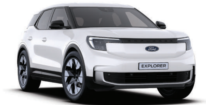
FROZEN WHITE - LAKIER ZWYKŁY 1 500,-