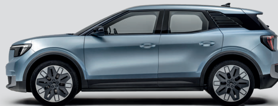
DEŁUGOŚĆ CAŁKOWITA: 4468 mm