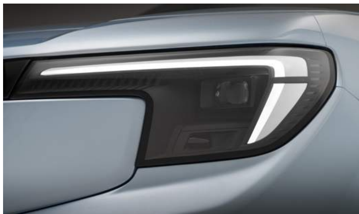
REFLEKTORY MATRYCOWE LED Standard dla wersji Premium