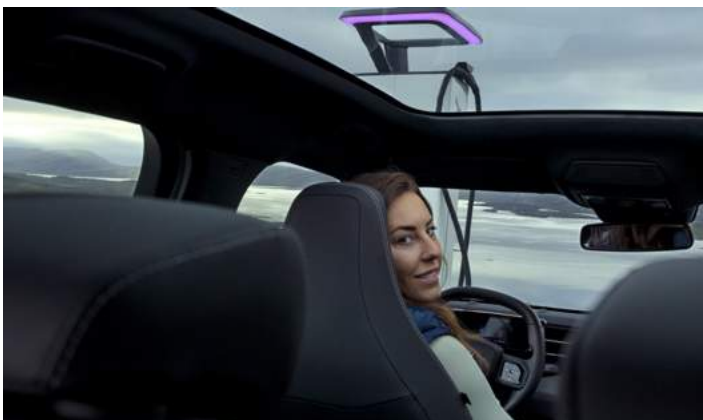
DACH PANORAMICZNY Opcja dla wersji PREMIUM