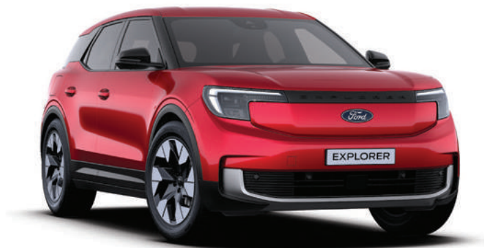
LUCID RED - LAKIER METALIZOWANY SPECJALNY 4 500,-