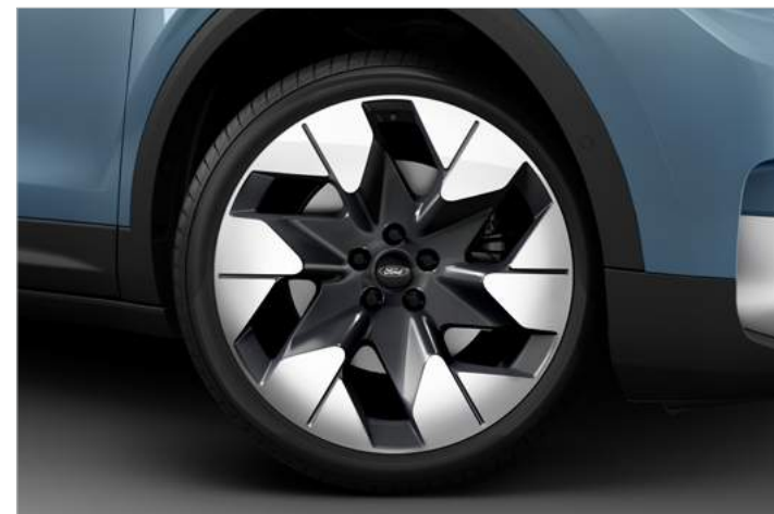
20" OBRĘCZE KÓŁ ZE STOPÓW LEKKICH, OGUMIENIE: PRZÓD 235/50, TYŁ: 255/45 Standard dla wersji PREMIUM