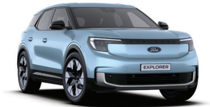
ARCTIC BLUE - LAKIER METALIZOWANY bez dopłaty