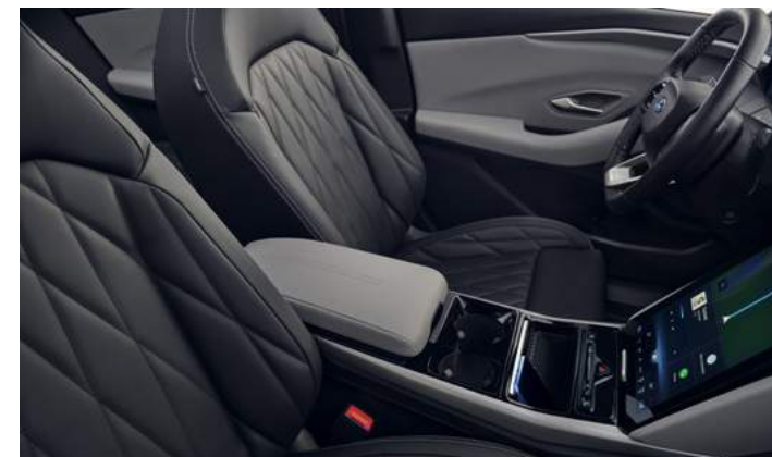
TAPICERKA SKÓRZANA (SKÓRA EKOLOGICZNA SENSICO) Standard PREMIUM