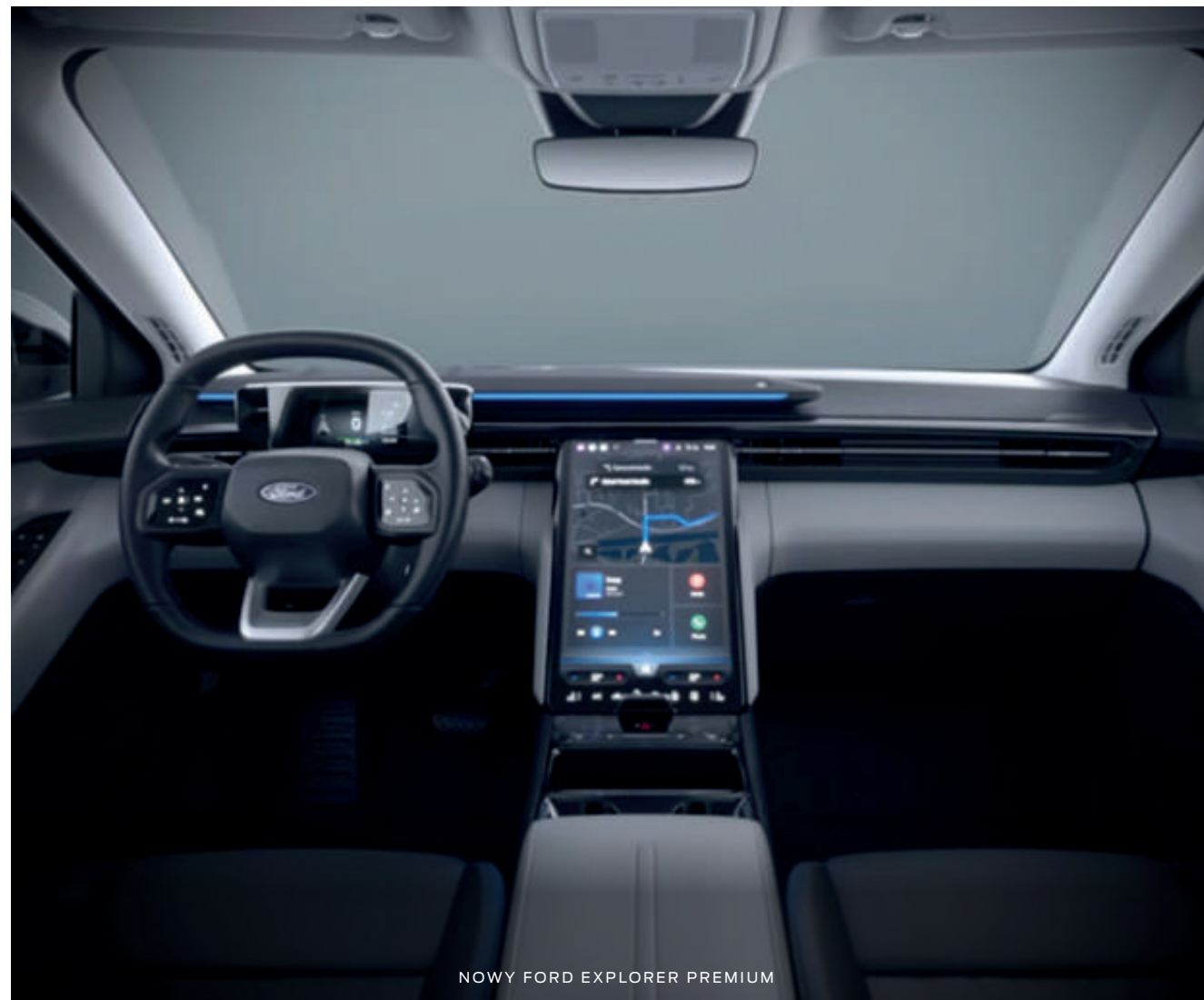
NOWY FORD EXPLORER PREMIUM