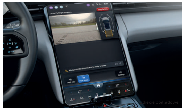
ACTIVE PARK ASSIST - SYSTEM WSPOMAGAJĄCY PARKOWANIE Opcja dostępna tylko w pakiecie Driver Assistance