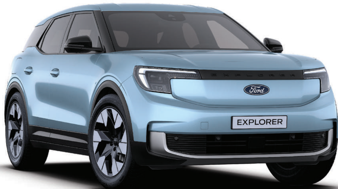
NOWY FORD EXPLORER PREMIUM KOLOR NADWOZIA: ARCTIC BLUE (BEZ DOPŁATY)