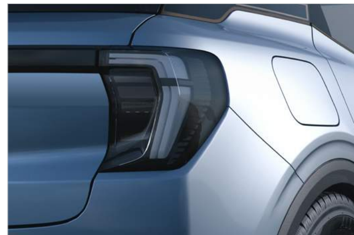
TYLNE ŚWIATŁA W TECHNOLOGII LED Standard dla wersji EXPLORER