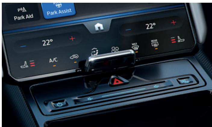
POMPA CIEPŁA Opcja dla wszystkich wersji