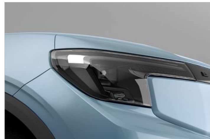
REFLEKTORY MATRYCOWE W TECHNOLOGII LED Standard dla wersji PREMIUM