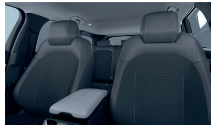
PRZEDNIE FOTELE ERGONOMICZNE, Z CERTYFIKATEM AGR, Z TAPICERKĄ CZĘŚCIOWO SKÓRZANĄ (SENSICO / ETON BLACK ONYX) Opcja dla wszystkich wersji