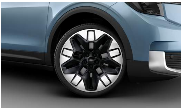
21" OBRĘCZE KÓŁ ZE STOPÓW LEKKICH Opcja dla wszystkich wersji